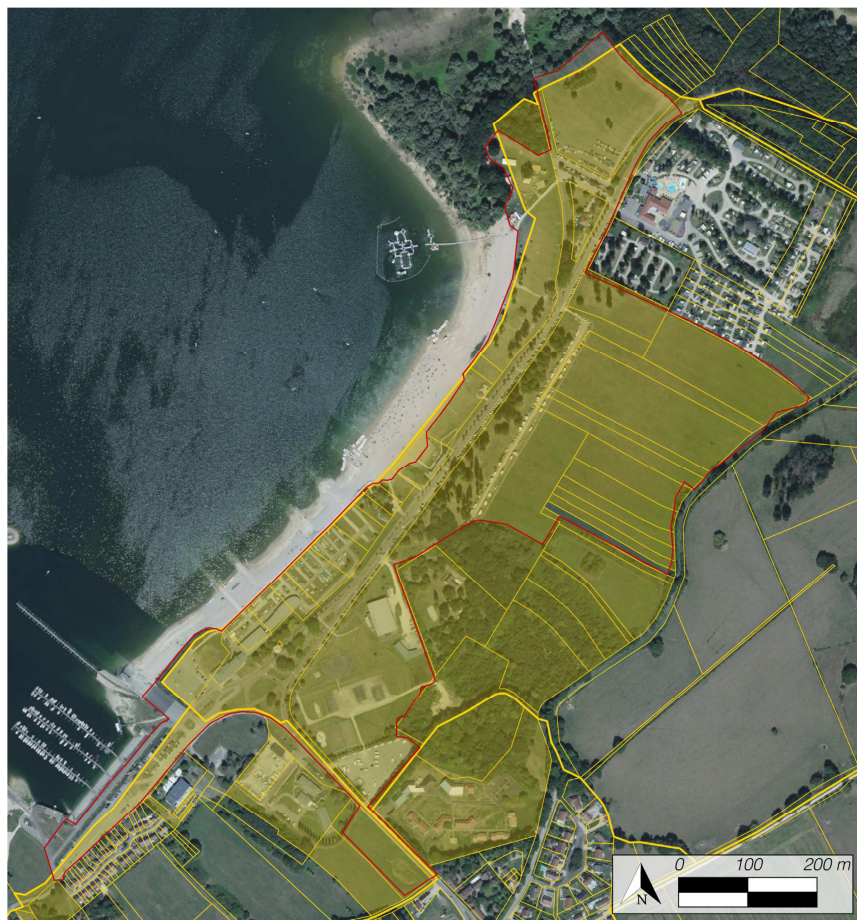
En jaune, le foncier appartenant au Département

Outre l'emprise de la route départementale 43 qui longe la plage, le Département de l'Aube est propriétaire de la quasi-totalité des parcelles qui sont situées dans la zone d'étude.