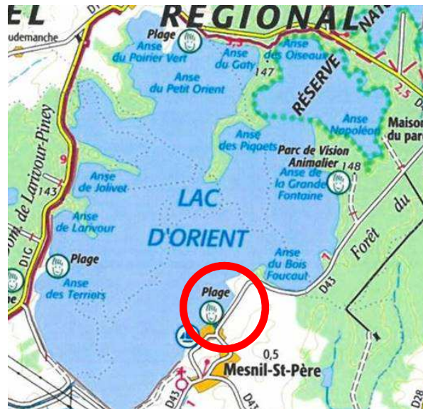
Localisation du site au bord du lac

Le site en question est situé sur le territoire de la commune de Mesnil Saint Père, au bord du lac d'Orient.